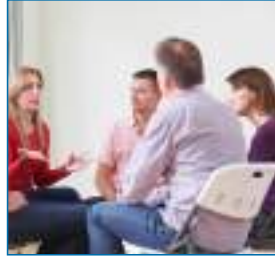
Psychoedukative Einheiten in der Gruppe