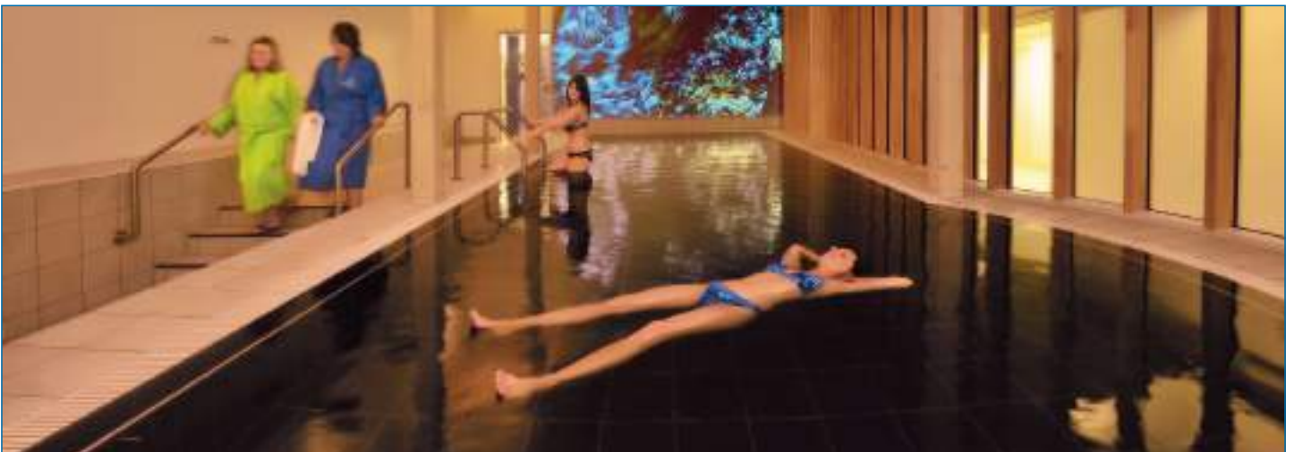
Heilbaden und Entspannungstherapie

*(Golf ist keine Kassenleistung, aber gegen einen geringen Aufpreis zubuchbar.)