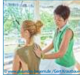
Physikalische Therapie z. B. Naturfang