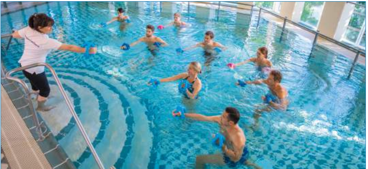
Aqua Fit in der Gruppe